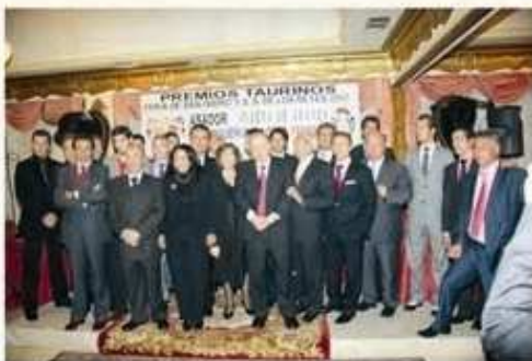
"Premiados año 2007"