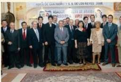
"Premiados año 2006"