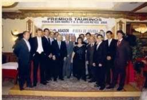
"Premiados año 2005"

Asador Ribera de Aranda y Marisquerías López Ferrero